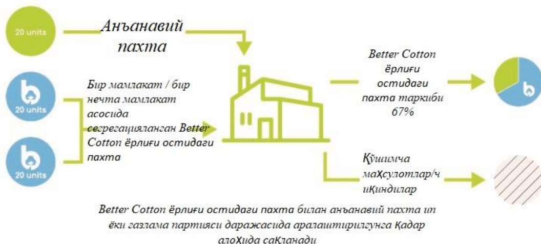
2-расм. Назорат остида аралаштириш тизимидаги УЎН модели кўриниши

1.2.3 Сегрегация (Бир нечта мамлакат) моделида Better Cotton ёрлиғи остидаги жисмоний пахта билан анъанавий пахтани фермер хўжалиги даражасидан бошлаб ажратиш талаб қилинади ва Better Cotton ёрлиғи остидаги жисмоний пахта билан анъанавий пахтани бутун таъминот занжири давомида аралаштириш ёки алмаштиришга йўл қўйилмайди. Мазкур модель Better Cotton ёрлиғи остидаги жисмоний пахта бир нечта (бирдан ортиқ) мамлакатдан келтирилганда қўлланади.