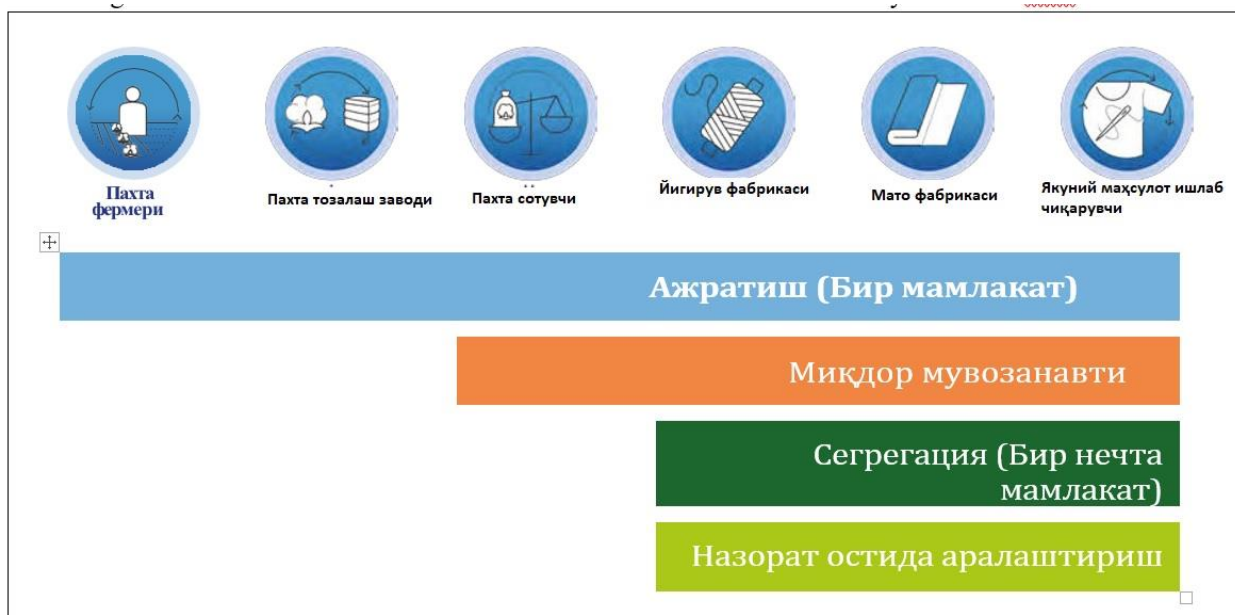
5-расм. УХН моделларининг таъминотчи турига қараб қўлланиши

Better Cotton маҳсулотидан фойдаланилгани акс эттирилган баёнотлар (Better Cotton Claims) билан боғлиқ маҳсулотларни сотиб олиш ёки сотишда қилиниши мумкин бўлган баёнотлар тўғрисида батафсил маълумот учун Better Cotton Claims Framework компонентиға қаранг.