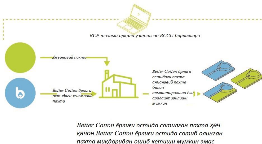
1-расм. Миқдор мувозанати тизимидаги УҲН модели кўриниши

1.2.1 Миқдор мувозанати (Mass Balance) – ҳисоб-китоб тизими бўлиб, Better Cotton маҳсулотидан фойдаланилгани акс эттирилган баёнотларни бир Better Cotton маҳсулотидан бошқасига жисмоний аралаштириш ёки маъмурий усул билан Better Cotton маҳсулотидан фойдаланганлик тўғрисидаги баёнот бирликлари (Better Cotton Claim Units - BCCUs) ёрдамида ўтказиш имконини беради. Бунинг натижасида Better Cotton маҳсулотидан фойдаланганлик тўғрисидаги баёнот бирликларида BCCU бирликларида Миқдор мувозанати буюртмаси сифатида сотиладиган жисмоний пахта миқдори таъминот занжири бўйлаб BCCU бирликларида (тегишли қайта ҳисоблаш коэффициентларини ҳисобга олган ҳолда) сотиб олинган пахта миқдоридан ошмаслиги таъминланади.